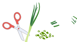
はさみで小口切りや2~3cmにカット

野菜や肉はカット済み、キッチンバサミでネギをカット。レタスは手でちぎるなどで、洗い物も減らす。