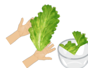
洗ってちぎって容器に入れる