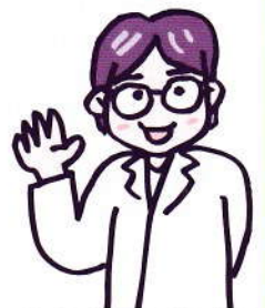
(北茂安店薬剤師/よしとみ)

ハウスダストは人の動きに合わせて空中に舞い上がりしばらく浮遊します。浮遊する微細なハウスダストは1時間に約30cmずつ、ゆっくりゆっくり時間をかけて降りてきます。床から天井までの距離を考えると、眠りについて5〜6時間後に床に落ちてしまつこととなります。このことから、床掃除はハウスダストが床にたまった朝一番に行なうのがベストだと言えます。その他、普段から定期的に換気をしっかりと行なうことも、ダニやカビの増殖を防ぐポイントです。これからの季節、加湿器の使用で湿気がこもることのないように注意しましょう。